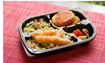
ひじき混ぜご飯弁当